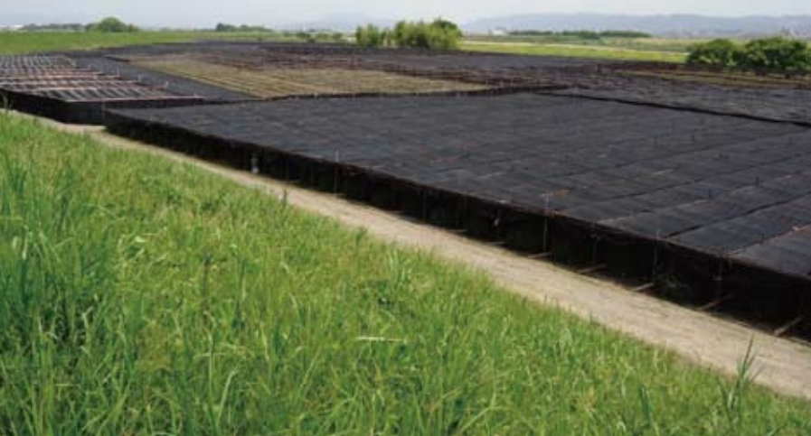
おいした 寒冷紗の覆下茶園 4月中頃から茶園に覆いがかけられていきます。一面覆われた茶園は新茶を控えたこの時期にしか見られません。

覆いを被せて育てる覆下栽培では、茶の木に係る負担も多くなるため、比較的多くの施肥が必要となりますが、京都から水路を通じて運ばれる糞尿を活用しやすいことや河川の氾濫により上流からの肥沃な土壌の流出がそれを賄うという地理的条件も栽培に適していました。