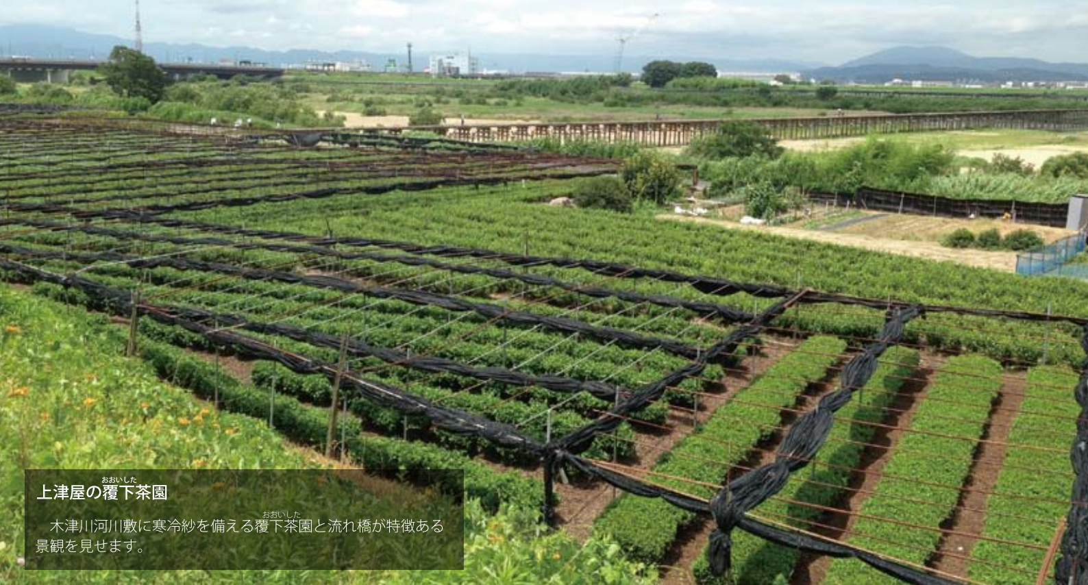
おいした 上津屋の覆下茶園 おいした 木津川河川敷に寒冷紗を備える覆下茶園と流れ橋が特徴ある景観を見せます。