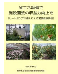
▲省エネで収益力向上を