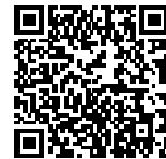
▲省エネ通知のページQRコード