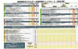
▲省エネチェックシート