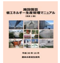
▲省エネマニュアル