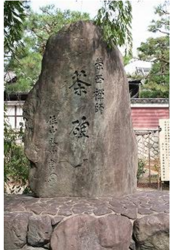
栄西禅師顕彰茶碑