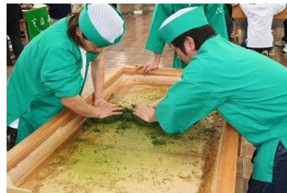
宇治茶手もみ製法