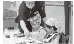
寿司づくり体験 (京都市 協力:大起水産株式会社)