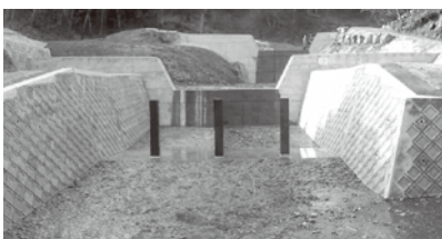
綾部市篠田町(令和7年3月完成)

令和5年8月に発生した台風第7号豪雨災害においては、京都府中丹地区を中心に、山地の渓流において、土石流が発生し、立木が土砂とともに下流の宅地や道路等に流入するなど、甚大な被害が発生しました。