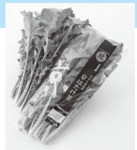
出荷された「京はたけ菜」

引き続き、関係機関と連携し、生産拡大に努めるとともに、近畿圏や首都圏の量販店での販売促進や、飲食店でのコラボメニュー開発による「京はたけ菜」のPRや販路拡大に取り組んでいきます。