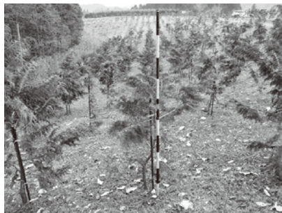
特定母樹ヒノキの採種園