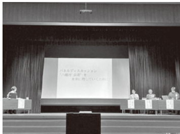
地域フォーラム開催風景

京都府では「宇治茶の文化的景観」の世界文化遺産登録に向けた取組を進めており、その一環として、景観保護の取組に対する地元の機運醸成のため、宇治茶の生産活動で形成された地域の景観が持つ価値や魅力について地元住民や関係者と意見交換し、地域としての認識を共有する地域フォーラムを開催しています。