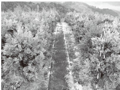
少花粉スギの採種園

今後とも、採種園の適切な管理により苗木の安定供給に努め、成長が早く花粉の少ない森林への転換を進めてまいります。