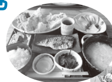
海業の取組例 (漁港めし)