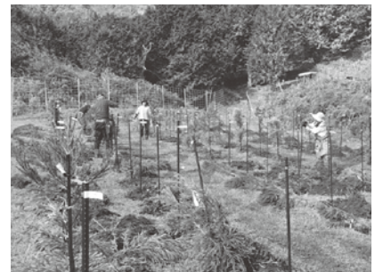
特定母樹スギの採種園(造成中)

農林水産技術センター 農林センター 森林技術センター TEL : 0771-84-0365