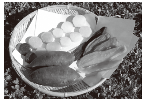
様々な品種を蒸しいもや干しいもに加工し、食味を調査

今後は、加工業者の意見を踏まえ、京都産干しいもとして消費者にアピールできる特徴を備えた1品種・1系統を選定していきます。