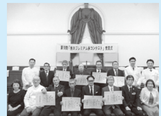
第9回京のプレミアム米コンテスト 最終審査及び授賞式