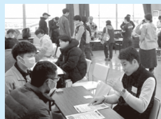
マッチングブースでの活発な交流の様子

今後も農福連携に係る研修会の実施や、農業者と福祉事業者間のマッチングなど、農福連携の輪を広める取組を進めてまいります。