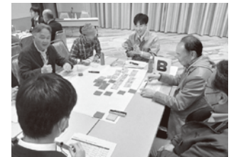
各地域の強み・課題について 意見交換の様子

※農村RMO:複数の集落の機能を補完して、農用地保全活動や農業を核とした経済活動と併せて、生活支援等地域コミュニティの維持に資する取組を行う組織