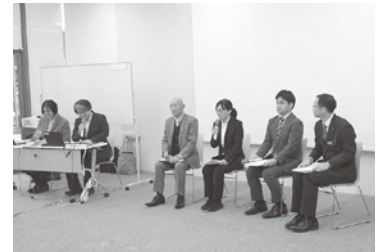
活発な意見交換が行われました