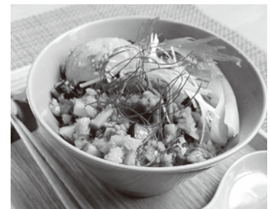
みんなハッピー! 京丹波ぼーくのこだわりルーローハン