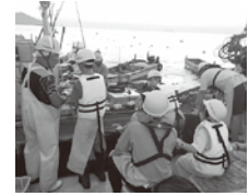
定置網 漁業体験 (宮津市 養老地区)

引き続き体験イベントなどを開催し、漁師という職業への理解を深めるとともに、京都の豊かな海の幸を使った食文化を次世代へと繋いでいきます。