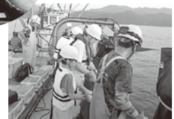
海業の取組例 (漁業体験)