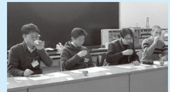
「農業の魅力体験研修会 (茶香服体験)」の様子

中丹広域振興局 農林商工部 中丹東農業改良普及センター TEL: 0773-42-2255 中丹西農業改良普及センター TEL: 0773-22-4901