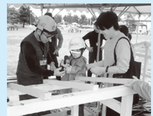
「小さな木の家」組立 ワークショップの様子