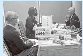
「就農相談会 in 中丹」の様子