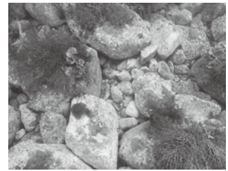
ウニに食べられて 衰退した藻場の再生を図る