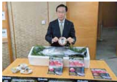
西脇知事が愛称を決定！

皆様に数多くのご応募をいただいた京都府産天然小型クロマグロの愛称は「都まぐろ」に決定しました！応募総数436件から西脇知事が選んだ名前です。多くの素敵な名前のご応募ありがとうございました！