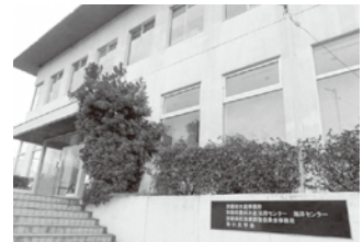
海洋センターの機能強化