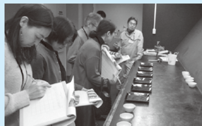
第3回(R8.2.20) 茶の品評会審査体験の様子

山城広域振興局 農林商工部 農商工連携・推進課 TEL：0774-21-2392