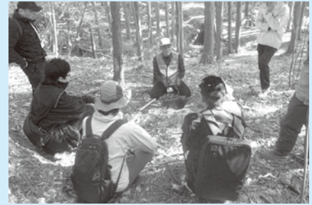
わなの設置方法の実演

今後も、こうしたセミナーの開催や地域と連携した取組を進め、狩猟や有害鳥獣対策を担う人材の育成に力を入れていきます。