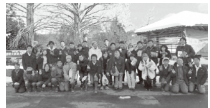
研修を受けた学生・研修生の皆様

引き続き、「京都府農林水産業人材確保育成戦略」に基づき、将来の農林水産業を担う人材の確保・育成のための、研修・教育内容の充実に取り組んでいきます。