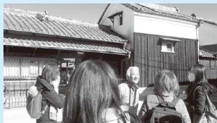
第2回(R8.1.21) 木津川市の茶問屋街見学の様子