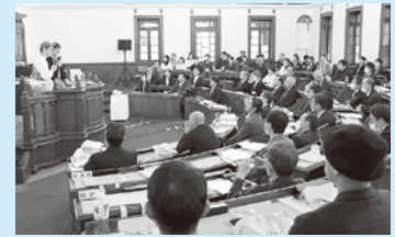
府民会議全体会講演会