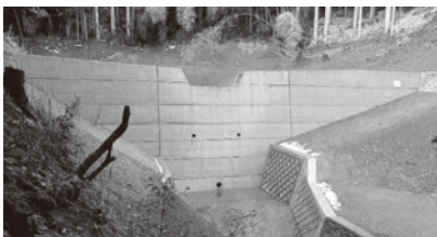
福知山市大江町河守(令和8年3月完成)