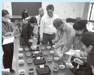
第1回(R7.11.26) お茶の合組体験の様子