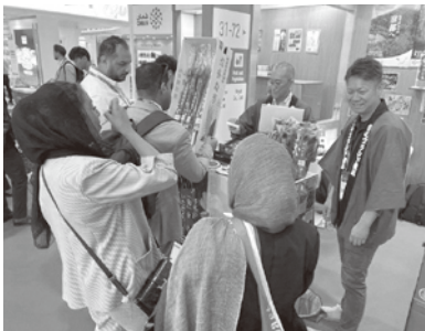
京都府ブース来場者に商品説明する出展者の様子

京都府や輸出に取り組む関係団体などで構成する京都府農林水産物・加工品輸出促進協議会が「Gulfood2026ジャパンパビリオン」(令和8年1月26日(月)～30日(金)/ドバイ)に出展しました。アラブ首長国連邦をはじめとする世界各地から有力な食品バイヤーが集う場で、京都の歴史とともに育まれた食材・食品の素晴らしさを伝えました。