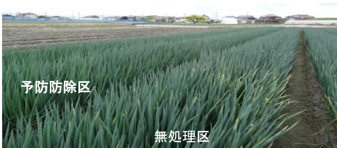
ネギべと病に対する予防防除の効果 (令和3年、京都伏見区)