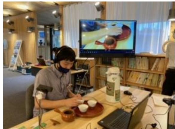
おいしいお茶の淹れ方を説明