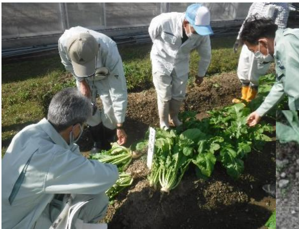
農林センター職員で形状を確認

新たな種子と保管種子から得られた植物体は違いがないことが確認されたので、今年度採種した種子を新たな保管種子として更新します。