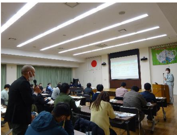
研究課題への質問に丁寧に回答