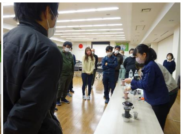
新提案の煎茶の入れ方に興味津々