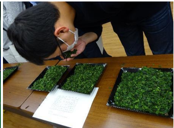
新型てん茶機による荒茶を吟味