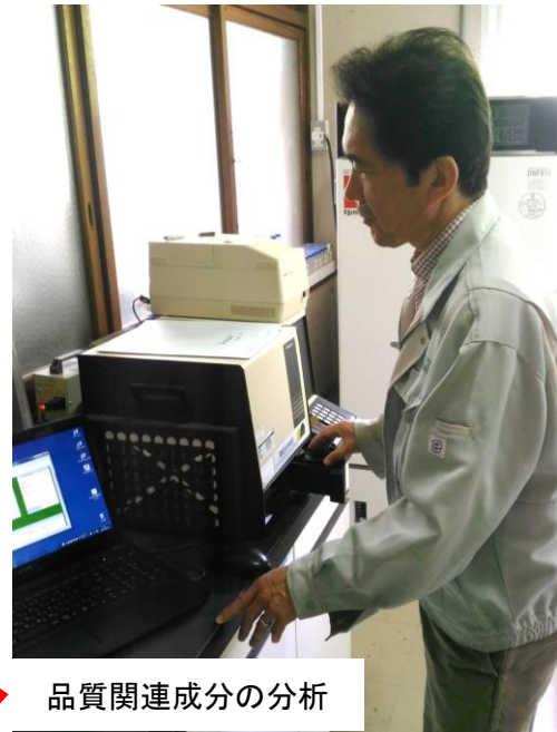
品質関連成分の分析

官能審査結果・価格と品質関連成分との関連性を解析し、 高品質な直がけてん茶の特性を解明