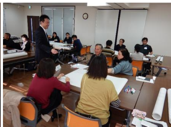
グループワークの様子