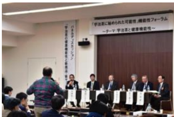
パネルディスカッションでの会場 参加者とパネラーの活発な議論

宇治茶産業のイノベーションに向け、分野横断の共同研究につなげることを目的として、異業種・異分野の企業・大学を含めた幅広い参加者間での情報共有、検討等を行う場