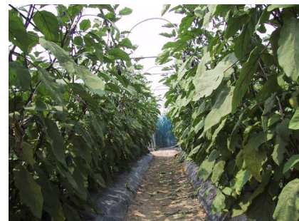
写真1 うね間は湛水せず、乾いている。