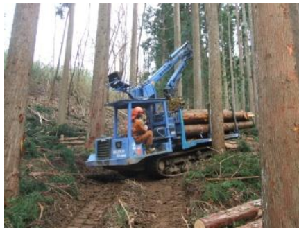
フォワーダによる運搬状況