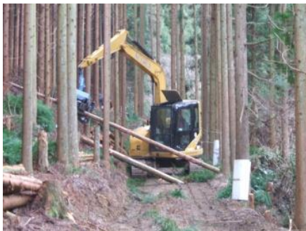
ハーベスタによる造材状況