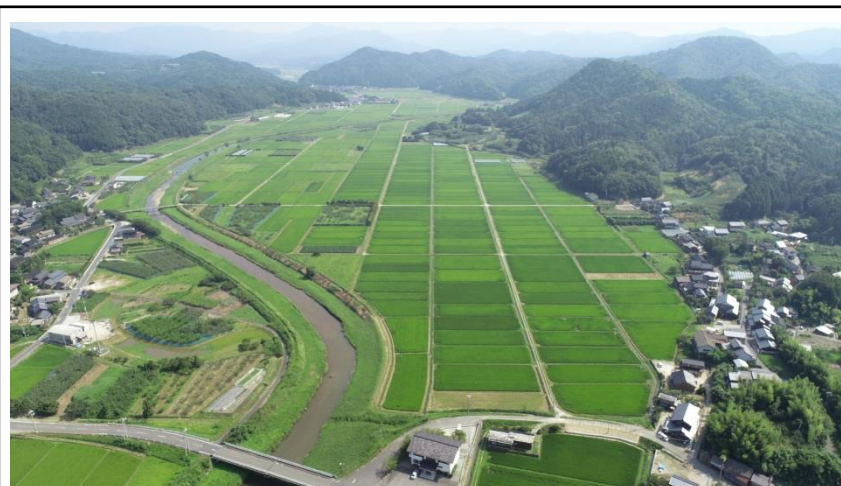
全景(佐濃谷川より上流を望む)