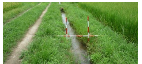
道路・水路の状況