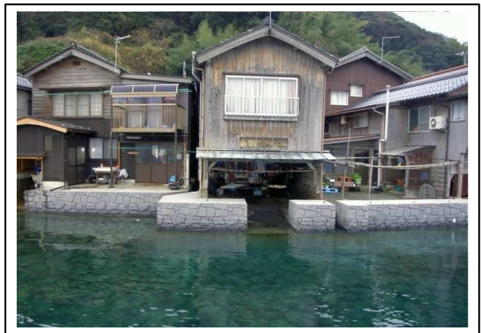
護岸整備後イメージ