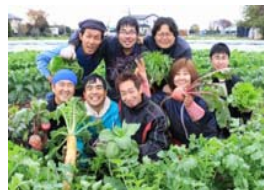
露地栽培による障害者雇用農園(茨城県つくば市)

保全すべきとされた都市農地に対し、本格的な農業振興施策が講じられるよう方針を転換