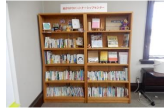
参考図書コーナー