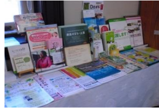
パンフレット&チラシコーナー