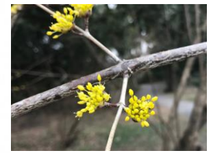
サンシュユ (大芝生地北側)