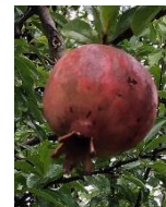
ザクロ (大芝生地西側)