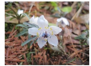
セツブンソウ (植物生態園)