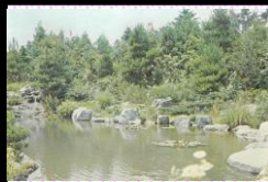
日本の森 (植物生態園)