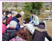
土曜ミニミニガイド (2006~)