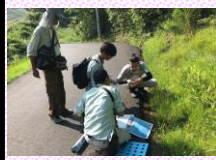
職員による現地調査(2023)

次の100年に向けた植物園将来像については、2022年の「有識者懇話会」における議論と同時にを行った植物園職員によるワーキングや府民の意見をもとにしたソフト・ハード両面の整備計画案が示されました。ハード面では観覧温室の建替え、標本庫・学習拠点施設の設置、どんぐりの森など子育てエリアの整備とバックヤードの拡充など盛り込まれました。また、ハード面を補強するソフト施策としては、未来の子どもたちに向けた学習コンテンツの拡充、植物多様性保全に向けた活動の強化と新標本庫と連動した「京都植物誌」の作成が打ち出されています。植物を通した憩いの場として機能と当園のもつ栽培技術をさらに高め、次の100年に向けた取り組みを順次進めていく必要があります。