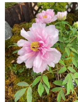
ボタン(早春の草花展)