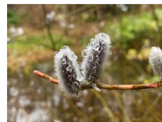
ネコヤナギ(植物生態園)