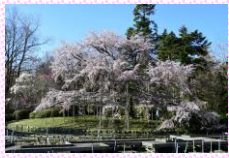
オオシダレザクラ

ヘリテージツリー②「オオシダレザクラ」～200年の植物園には200年の木がある～ 京都の桜守佐野藤右衛門氏と当園の関係は、大正時代の植物園創設期の寺崎良策主任技師との関係にまで遡ります。寺崎は明治神宮の創建に関わったのち、京都植物園建設のために赴任します。寺崎は優れた桜品種保全のために東京荒川堤由来のサトザクラ38種を先々代(第14代)佐野藤右衛門父子に託しています。そのサクラは、戦後の荒廢で枯死寸前だった園内のサクラに変わり、再開園以降の桜見本園設置の際に用いられました。その後の桜林の充実には当代(第16代)の藤右衛門氏の大いなる力添えをいただきました。花しょうぶ園北側のオオシダレザクラは、円山公園の先代「祇園枝垂れ」の種子から育てられた苗が寄贈され、1964年に植栽した個体です。