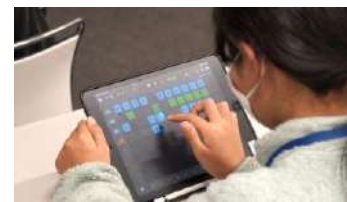
【プログラミング作曲体験の様子】