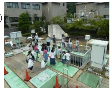
過去の様子（施設見学）