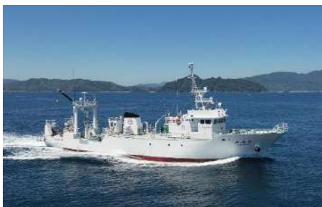
海洋調査船「平安丸」

各体験メニューとも複数回実施する予定ですが、参加希望者が一定数を超えた場合には参加をお断りする場合がございますので、御了承願います。