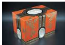
服部一齋《朱金地高蒔絵飾箱した》