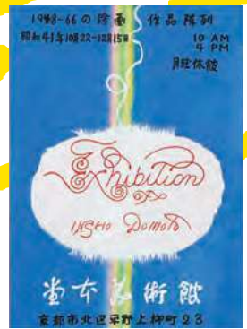
展覧会ポスターも印象作!!

In 2026, the museum will honorary hold the commemorative exhibition to celebrate the museum's 60th anniversary of opening by tracing its history.