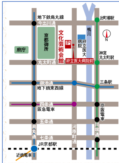
【京都府立文化芸術会館】