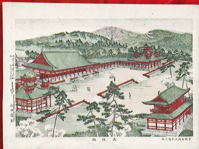
「京都名所五十景」のうち「大極殿」