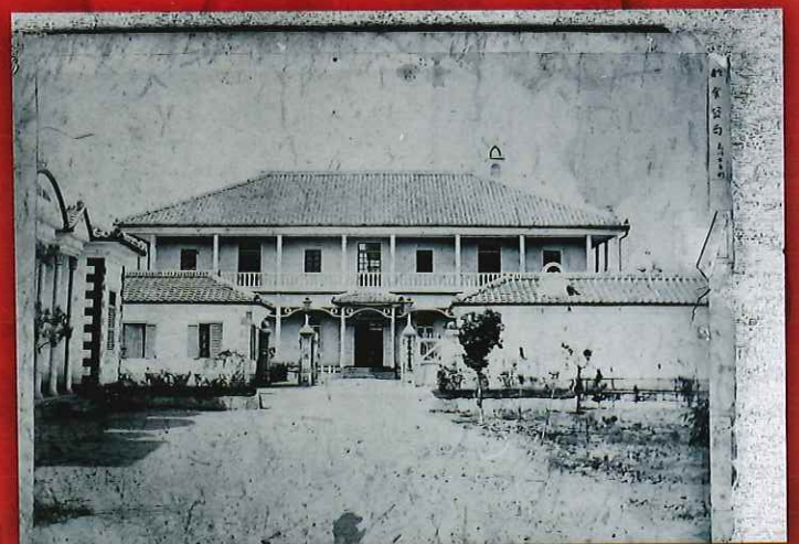
京都舎密局