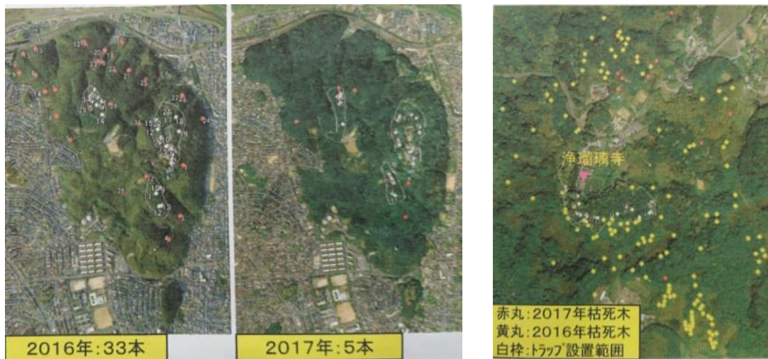
赤丸：枯死木 白丸：トラップ設置木