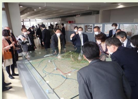
▲式典後 ジオラマ前での歓談