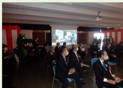
▲供用開始セレモニー(放流映像)