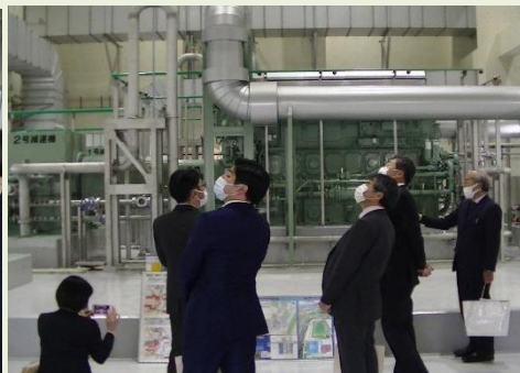
▲施設公開 呑龍ポンプ場1階