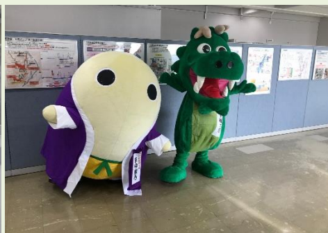
▲まゆまろと呑龍太郎