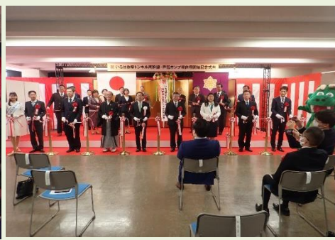
▲供用開始セレモニー(テープカット・くす玉開披)