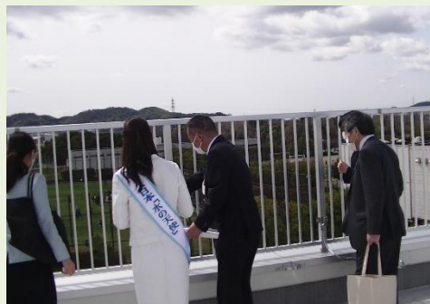
▲施設公開 呑龍ポンプ場屋上