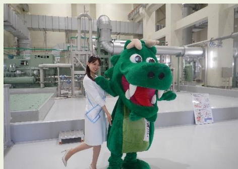
▲水の天使と呑龍太郎