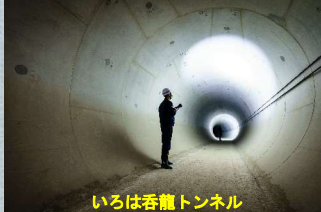
いろは呑龍トンネル

【開始時刻】①10:30 ②13:30 【見学時間】約60分 【対象年齢】小学生以上 【定員】各回10名程度 (雨天時は中止します)