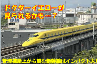
ドクターイエローが見られるかも...? 管理棟屋上から望む新幹線はインパクト大!

【開始時刻】①11:00 ②12:00 ③13:10 ④14:00 【見学時間】約30分 【対象年齢】小学生以上 【定員】各回20名程度