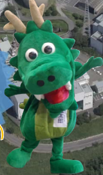
いろは呑龍トンネルマスコット 「呑龍太郎」

アクアパルコ洛西 (洛西浄化センター公園) ファミリーフェスティバル 同時開催 (ウルトラマンもやってくる)