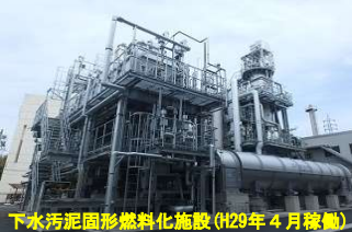
下水汚泥固形燃料化施設(19年4月稼働)

【開始時刻】①10:30 ②13:00 【見学時間】約90分 【対象年齢】小学生以上 【定員】各回20名程度