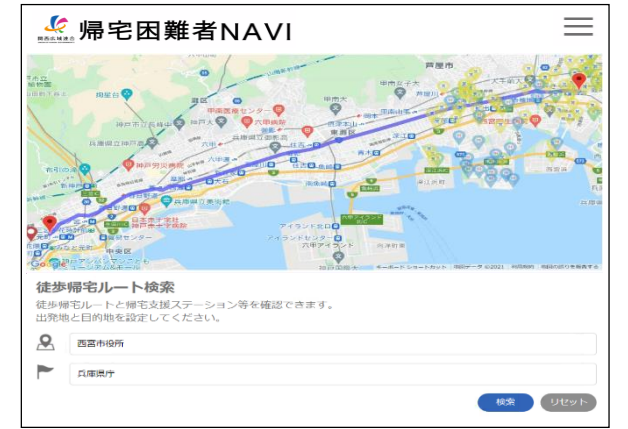
ポータルサイト(検索画面)

・広域連合は、帰宅ルートや沿道の帰宅支援ステーション等をインターネット上の地図で確認できる「関西広域連合帰宅困難者NAVI（ナビ）」の作成・運用により、帰宅困難者の円滑な帰宅を支援する。