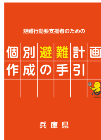
個別避難計画作成の手引 (兵庫県作成)