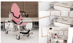
介護・自立支援設備 Wells/積水ホームテクノ