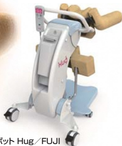
移乗サポートロボット Hug/FUJI