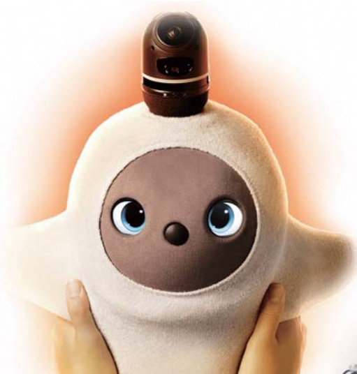
コミュニケーションロボット ラボット

およそ30社の出展を予定! ICTツールや介護ロボットなど、 介護現場が抱える課題解消のための最新のソリューションを展示!