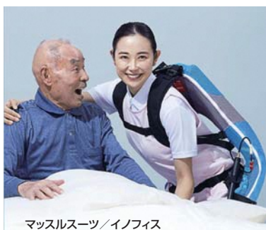
マッスルスーツ/イノフィス