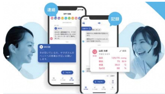
CareWiz ハナスト/ケアコネクトジャパン