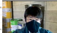
工業用油卸に入社