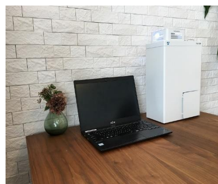
Fu-Jin（フージン）FJ-10Hの外観と構成