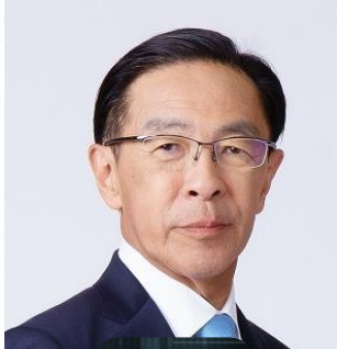
吉野 彰 氏 旭化成(株)名誉フェロー