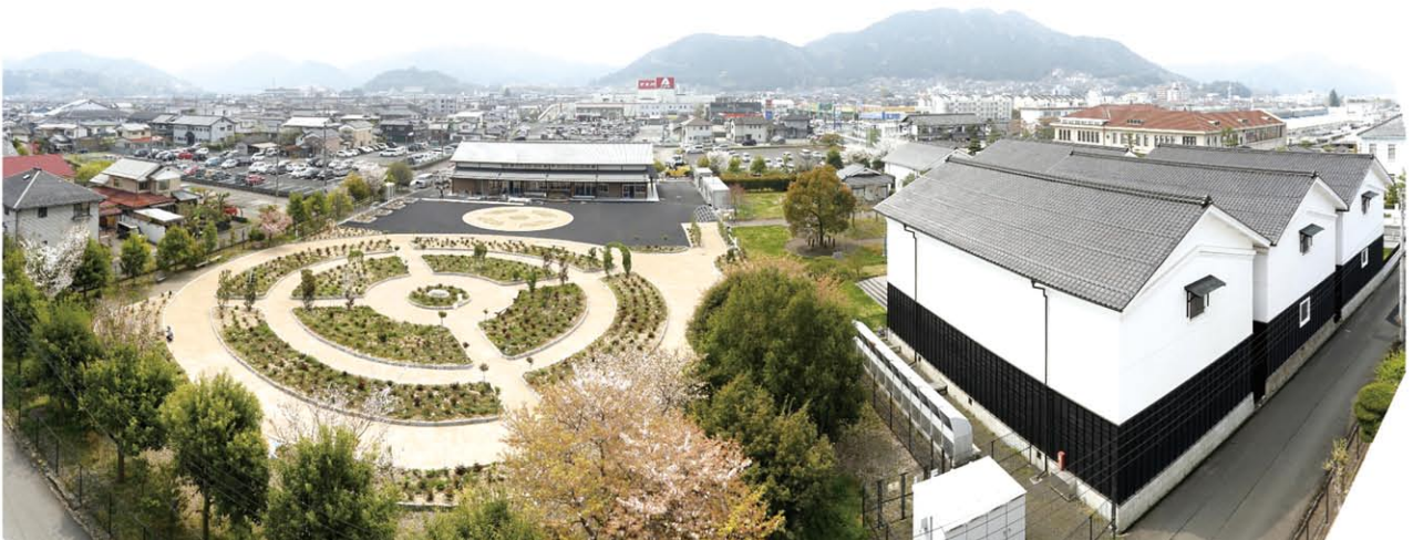
あやべグンゼスクエア