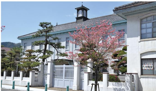
グンゼ記念館(近代化産業遺産群33 H19.11経済産業省選定)

京都府のほぼ中央部に位置。明治の頃より「蚕都」として栄え、グンゼ発祥の地として知られる綾部市。市街地を風光明媚な由良川が流れる山紫水明のまちでもある。近年整備が進む高速道路網のみならず、JR山陰本線と舞鶴線の分岐にもあたり、古くから京都府北部における交通の要衝として発展してきた。優れた物流環境を背景に「安らぎと豊かさを実感できる交流・産業拠点都市」の形成をめざしている。