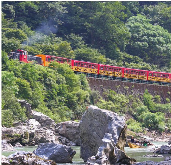
トロッコ列車と保津川下り

亀岡市は、京都市の西隣に位置し、京阪神都市圏とのすぐれたアクセスと豊かな緑につつまれた快適な生活空間を有し、暮らしや経済、観光にも便利な京都府内3番目の人口を有する市です。ベッドタウンとしての成長と同時に企業立地も着実に進展、産業が集積された地域としての存在を強めています。京都縦貫自動車道が名神高速道路に直結し、交通アクセスが向上したことにより、企業活動にとって非常に高いポテンシャルが魅力です。