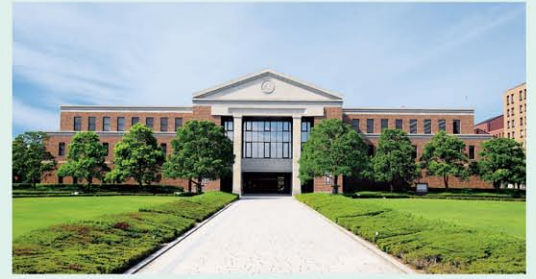
同志社大学京田辺キャンパス

( D-egg は中小機構が同志社大学・京都市・京田辺市と協力して運営するインキュベーション施設です )