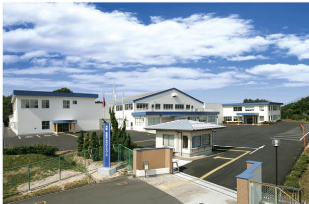
丹後・知恵のものづくりパーク(産業支援・人材育成施設)

森本工業団地 赤坂工業団地、清水工業団地、大山工業団地、永留工業団地、谷工業団地