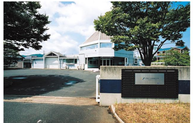
京都工芸繊維大学京丹後キャンパス(地域連携センター)