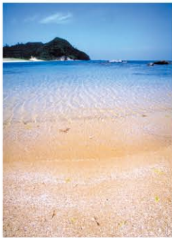
琴引浜の鳴砂(天然記念物)

平成25年度には「京丹後市商工業総合振興条例」を制定し企業立地支援制度を創設しました。企業の皆様に、ともに歩み、まちづくりを進めるパートナーとなっただけのよう、「日本のものづくりのふるさと」京丹後市への立地を心よりお待ちしております。