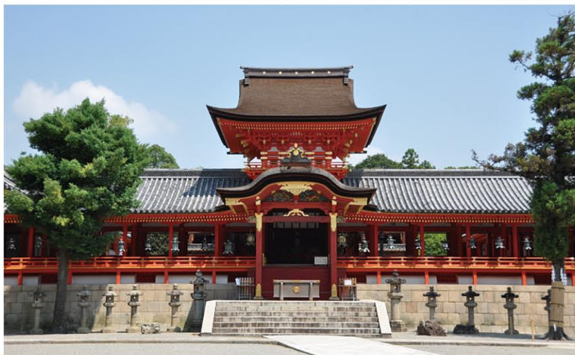
石清水八幡宮 本社(国宝)