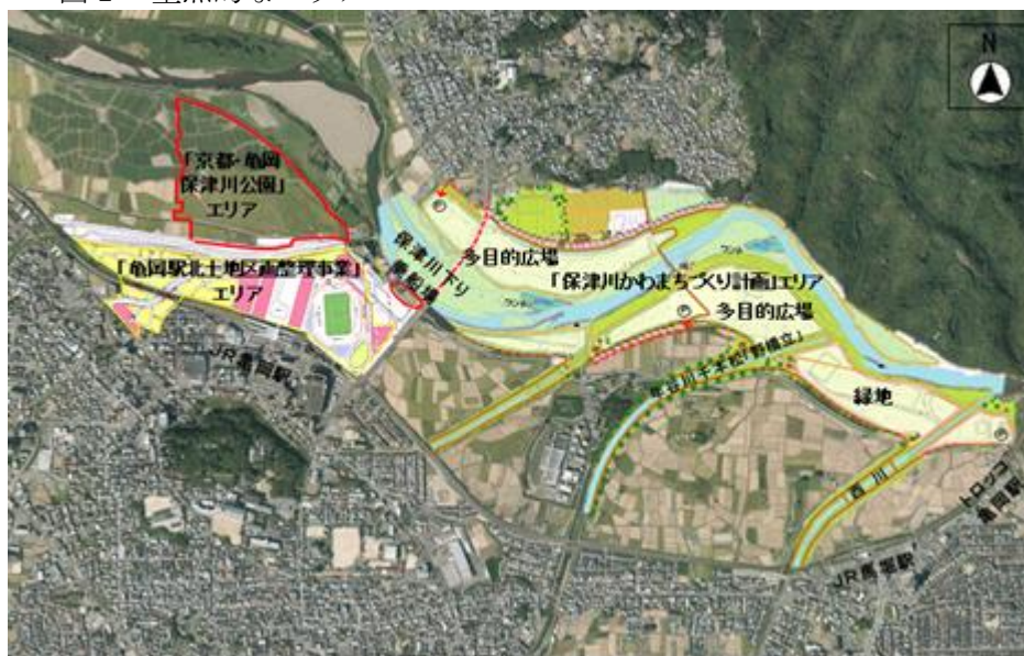
図 1 重点的なエリア

このため、本促進区域の中でも、特に図 1 に示した「亀岡駅北土地区画整理事業」エリア、「京都・亀岡保津川公園」エリア、桂川改修で生じた高水敷等の「保津川かわまちづくり計画」エリア等において、これらのエリアの地域特性が最大限発揮されるよう基盤づくりを進める。まず、土地区画整理事業地内の京都スタジアムにおいては、国際試合や日本プロサッカーリーグ等によるスポーツ興行の開催や年間を通じた多様なイベントの開催による交流人口の拡大に取り組み、さらに、複合機能化したスタジアムと土地区画整理事業地に誘致される商業施設との連携や双方向の多角的な利用を図っていく。また、亀岡市が、天然記念物アユモドキの保全と環境教育や体験学習の場として活用する都市公園を整備するとともに、京都府と亀岡市が連携して、図 1 のエリア内でアユモドキの総合的・広域的な保全対策等を実施し、新たな地域観光資源として展開する。これらの取組に加え、既存の観光資源とのネットワークを強化し、入込客の滞留時間を伸ばすため、京都スタジアムを含む上記のエリア全体を利活用した「スポーツ・観光・まちづくり」事業を推進することにより、京都市域を訪れる観光客や国際旅客港として機能強化を進める舞鶴港からの外国人旅行者等を取り込み、入込客等を市場とする小売業、宿泊業、飲食サービス業などの雇用の創出と観光消費の拡大を図る。また、新しいまちの機能を高度化するため ICT 化に取り組み、それにより得られたビッグデータを公開し、そのデータを活用した新たな観光ビジネス等の創出で好循環を目指す。