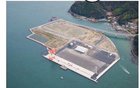
京都舞鶴港 みずなぎふ頭 らくなん進都（高度集積地区）等、 府内の物流・産業拠点との連携強化