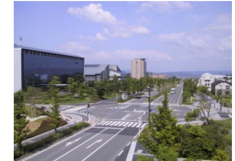
関西文化学術研究都市 桂イノベーションパーク等、府内の 研究活動拠点との連携強化