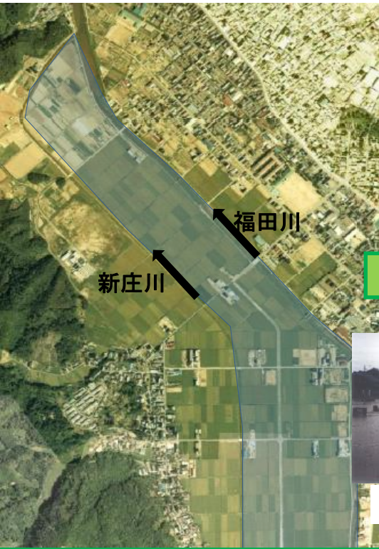
昭和50年代