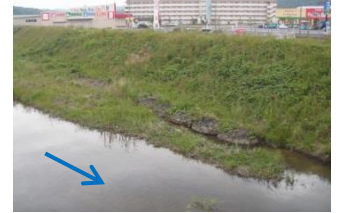
商業施設の様子 (手前:福田川)