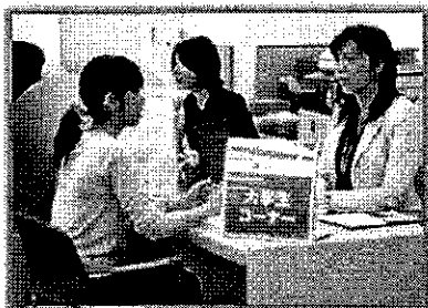
大学生・留学生 コーナー新設