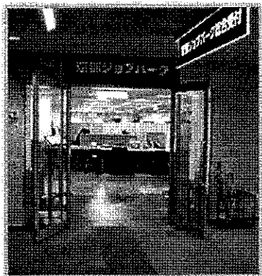
フロア・サイン見直し