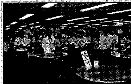
理念は毎朝みんなで唱和しています♪