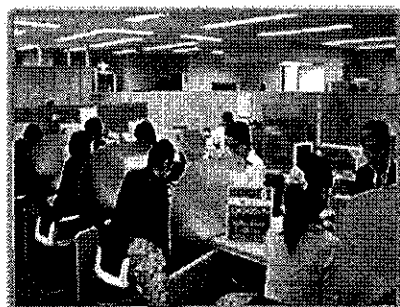
ハローワークとの 一体型運営