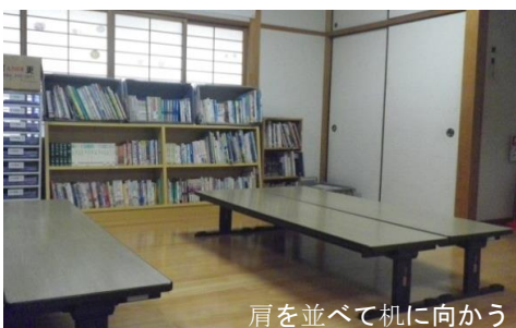
肩を並べて机に向かう

吉川小学校と町の自治会が連携して取り組んでいるので、校長、教頭、担任を持たない先生ほか、町内のお母さんや団地に住む小学生の母親や、地域のお年寄りが交代で見守ってくれています。