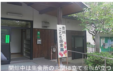
開館中は集会所の玄関に立て看板が立つ