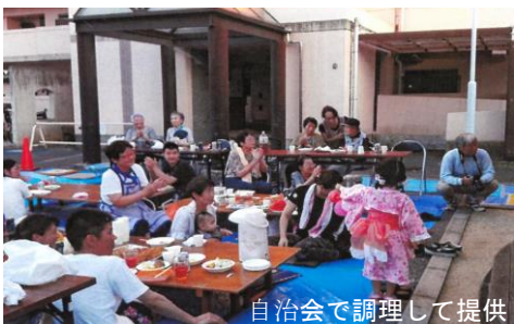
自治会で調理して提供