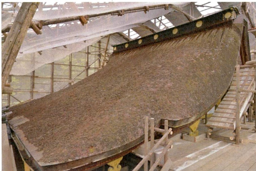
檜皮葺修理前の状況